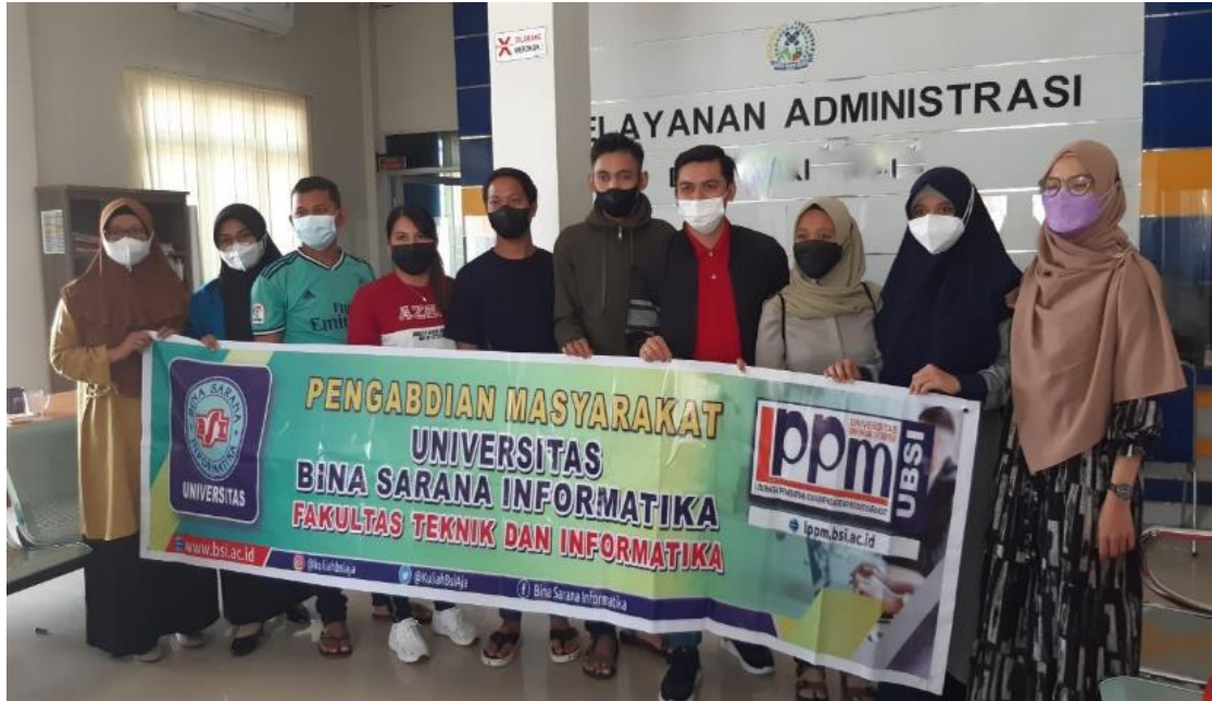
Gambar 3. Foto Bersama Peserta Pelatihan

Aplikasi buku tamu digital yang di sosialisasikan menyediakan 2 level akses pengguna, yaitu admin dan operator. Yang membedakan keduanya adalah di menu admin terdapat data user dan laporan. Aplikasi hanya membahas tentang buku tamu dimana aktivitas yang ada seperti aktivitas tamu yang masuk dan keluar beserta detail lamanya pertemuan antara tamu yang bersangkutan dengan pejabat yang ditemui serta adanya Whatsapp Blast yang digunakan untuk menginformasikan kepada tamu apabila pejabat yang akan ditemui telah berada di Kantor. Penyimpanan data tamu berada dalam database SQL server. Supaya aplikasi bisa diterapkan pada Kantor desa, diharapkan aplikasi terhubung dengan jaringan internet agar fitur pemberitahuan melalui aplikasi media sosial Whatsapp bisa berjalan dengan baik.