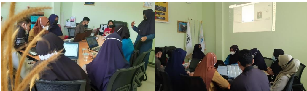
Gambar 2. Kegiatan pelatihan berlangsung

Untuk mencapai hasil maksimal dan efisien, maka harus dilakukan perubahan pada buku tamu di Kantor Desa Arang Limbung Kabupaten Kuburaya. Dengan cara membuat program aplikasi dimana pengunjung yang 54omput ke Kantor Desa Arang Limbung Kabupaten Kuburaya tidak lagi mengisi buku tamu secara konvensional, tapi petugas bisa langsung mengisikan secara langsung data kunjungan pada aplikasi yang sudah ada dalam 54omputer. Apabila pimpinan Kantor Desa Arang Limbung Kabupaten Kuburaya meminta rekapan data pengunjung. Maka pegawai yang bertugas bisa langsung mencetak laporan buku tamu pada Aplikasi Buku Tamu Digital.