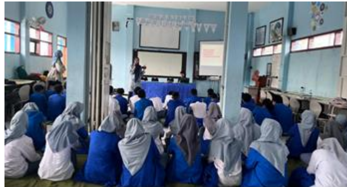
Gambar 2. Pelaksanaan Psikoedukasi.

Selain menunjukkan peningkatan skor secara kuantitatif, pelaksanaan psikoedukasi juga memperlihatkan respons yang cukup baik dari partisipan selama kegiatan berlangsung. Pada sesi diskusi interaktif, beberapa siswa terlibat dalam proses tanya jawab serta memberikan tanggapan terhadap contoh kasus yang diberikan. Suasana kegiatan berlangsung komunikatif dan peserta terlihat mengikuti jalannya kegiatan hingga selesai. Pendekatan interaktif yang digunakan membantu peserta untuk lebih mudah memahami materi yang disampaikan, terutama terkait bentuk, risiko, dan dampak perilaku seksual menyimpang pada remaja.