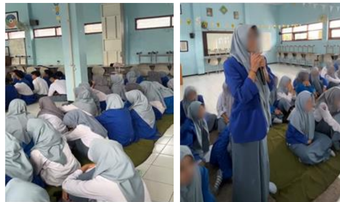
Gambar 3 dan 4. Pelaksanaan Psikoedukasi.

Hasil program pengabdian ini mendukung bahwa psikoedukasi dapat meningkatkan pengetahuan dan mengubah sikap siswa terhadap perilaku seksual menyimpang. Temuan ini tercermin dari adanya peningkatan skor yang signifikan antara pretest dan posttest, yang menunjukkan bahwa intervensi yang diberikan mampu memberikan pemahaman baru yang lebih baik kepada siswa. Peningkatan tersebut tidak hanya menunjukkan bertambahnya informasi yang dimiliki peserta, tetapi juga mengindikasikan adanya proses internalisasi pengetahuan yang dapat mempengaruhi cara pandang mereka terhadap perilaku seksual. Menurut Andriani, Suhrwardi, & Hapisah (2022), peningkatan pengetahuan dan sikap memiliki hubungan yang erat dengan penurunan kecenderungan remaja untuk melakukan perilaku seksual pranikah. Hal ini menegaskan bahwa pengetahuan berperan sebagai fondasi utama dalam pembentukan sikap, yang pada akhirnya akan mempengaruhi perilaku individu. Dengan demikian, ketika remaja memiliki pemahaman yang lebih baik mengenai risiko, konsekuensi, dan batasan perilaku seksual, mereka akan lebih mampu mempertimbangkan keputusan yang diambil.