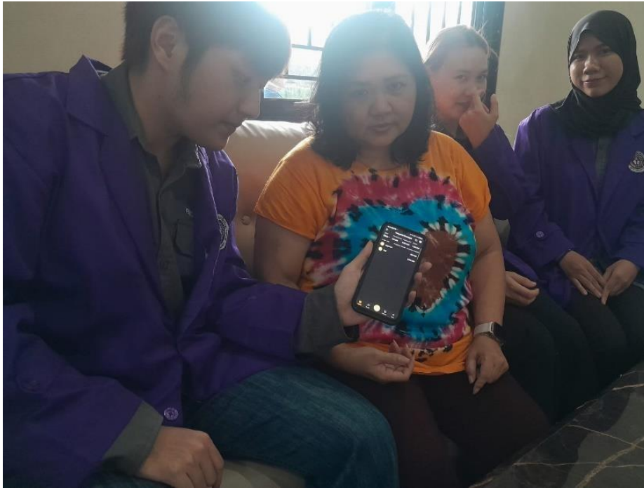
Gambar 2. Proses pendampingan penggunaan aplikasi Money Tracker

Tahap ketiga adalah pelatihan penggunaan aplikasi Money Tracker. Pada tahap ini, mitra didampingi untuk mengunduh aplikasi, mengenali tampilan awal aplikasi, memahami fitur pemasukan dan pengeluaran, serta mempelajari cara mengelompokkan transaksi sesuai kebutuhan usaha. Tim juga memperkenalkan fitur dashboard grafis, fitur pencatatan pengeluaran, fitur pencatatan pemasukan, dan fitur transfer sebagai bagian dari pengelolaan informasi keuangan digital. Pelatihan dilakukan secara langsung agar mitra dapat mencoba setiap fitur aplikasi sesuai dengan kondisi transaksi yang terjadi pada Toko Hawaii Alat Jahit Samarinda.