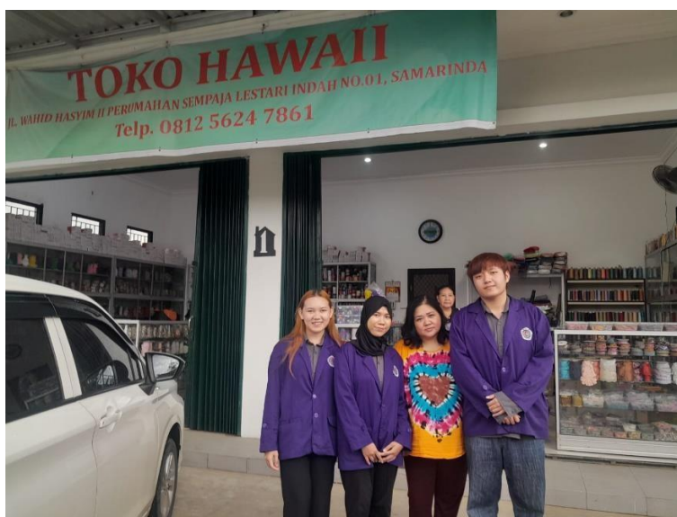
Gambar 1. Pertemuan bersama pemilik Toko Hawaii Alat Jahit Samarinda

Tahap kedua adalah edukasi mengenai pentingnya pengelolaan keuangan digital bagi UMKM. Pada tahap ini, tim memberikan penjelasan sederhana mengenai manfaat pencatatan keuangan yang tertib, pentingnya memisahkan keuangan pribadi dan usaha, serta peran aplikasi digital dalam membantu pelaku usaha memantau kondisi keuangan secara lebih mudah. Materi disampaikan secara langsung dengan bahasa yang sederhana agar mudah dipahami oleh mitra.