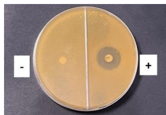
Gambar 1. Menggunakan Obat Ketokonazol Sebagai Kontrol positif