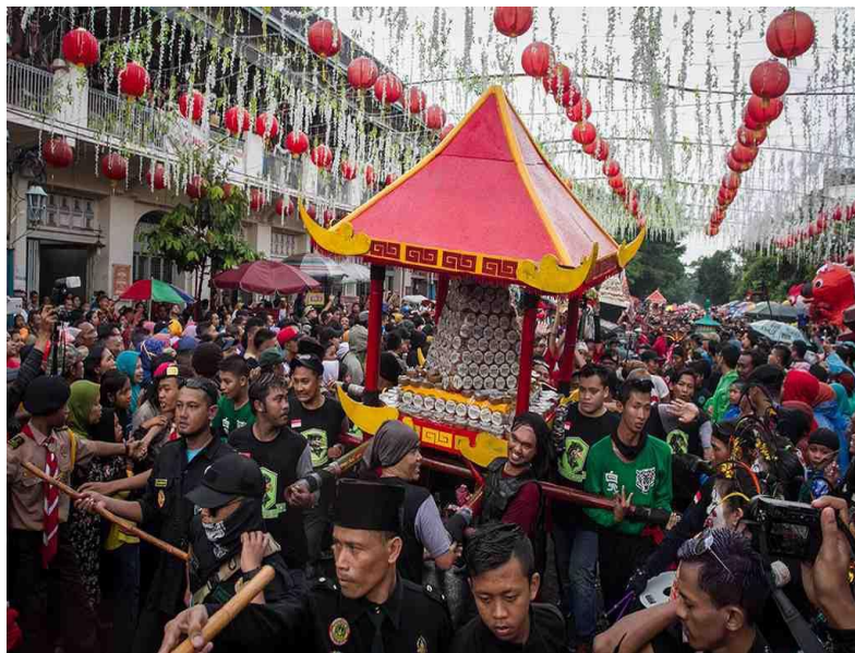
Gambar 1. Infopublik.id. (n.d.). Dokumentasi kegiatan Grebeg Sudiro Surakarta.

Dalam konteks Grebeg Sudiro, modal sosial membantu menjaga solidaritas masyarakat sekaligus mempermudah koordinasi antaranggota komunitas. Hubungan sosial yang telah terbentuk sebelumnya memungkinkan warga bekerja secara lebih fleksibel dan saling membantu ketika terjadi kendala di lapangan. Dengan demikian, koordinasi SDM dalam event budaya berbasis komunitas tidak hanya bertumpu pada struktur formal organisasi, tetapi juga pada kekuatan hubungan sosial masyarakat sebagai fondasi utama pengelolaan event.