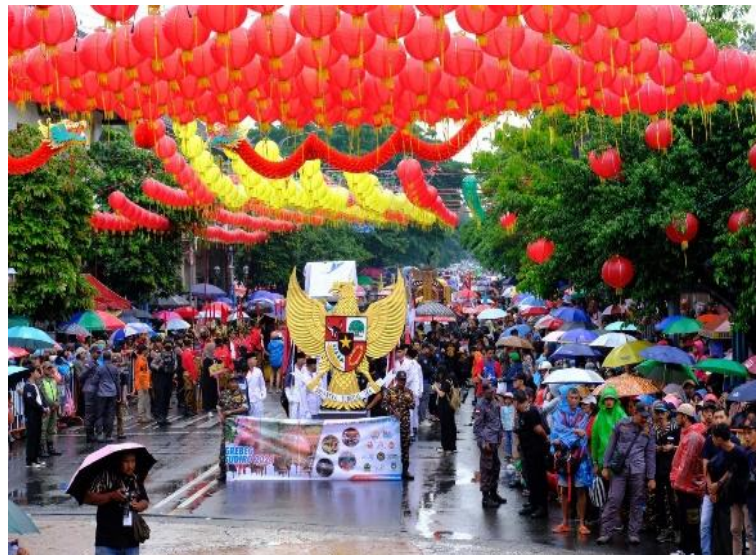
Gambar 4. Lajur Prima. (n.d.). Dokumentasi kirab budaya Grebeg Sudiro