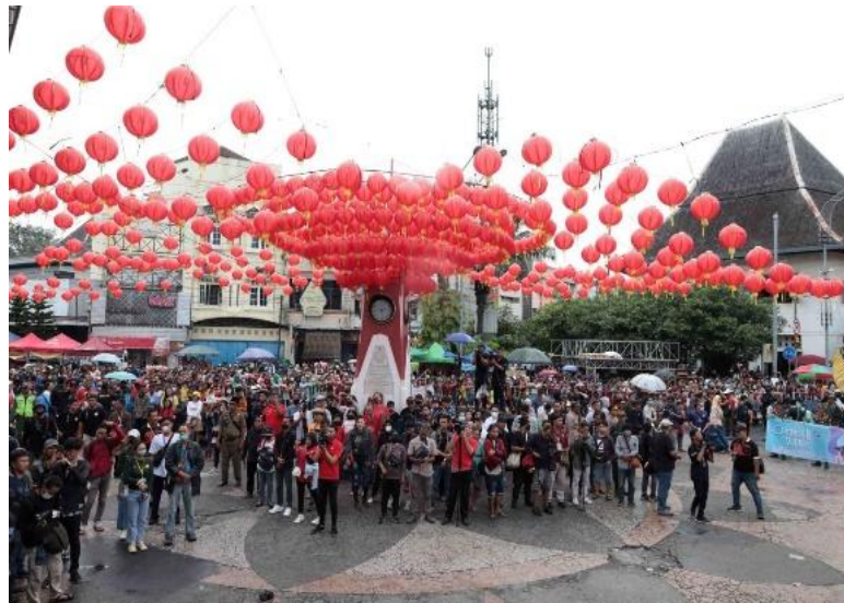
Gambar 3. Semarang Network. (n.d.). Dokumentasi festival budaya Grebeg Sudiro.