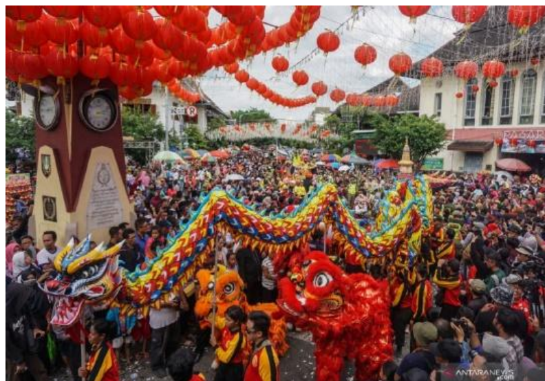
Gambar 2. ANTARA News. (n.d.). Dokumentasi Festival Grebeg Sudiro.