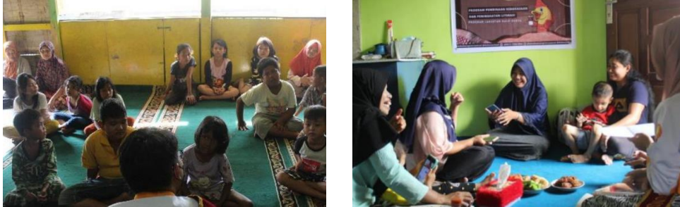
Gambar 1. Kegiatan Pembinaan Bahasa dan Sastra

waktu, program ini berkelanjutan selama 10 hari. Selama 10 hari tersebut, peneliti melakukan pemantauan secara daring setiap hari untuk menanyakan progres penggunaan dari layanan tersebut.