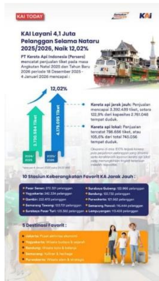
Gambar 1. Jumlah Penumpang Pada Stasiun Selama Nataru 2025/2026

Pengalaman yang bermakna terbentuk melalui pelayanan, interaksi sosial yang positif, serta kenyamanan selama perjalanan. Meskipun demikian, kajian yang secara khusus mengaitkan makna perjalanan, pelayanan, dan kebahagiaan wisatawan dalam konteks transportasi kereta api, khususnya di Jawa Barat, masih terbatas. Sebagian besar literatur lebih berfokus pada aspek teknis operasional ketimbang dimensi psikologis dan emosional wisatawan. Stasiun Bandung dipilih sebagai lokasi penelitian karena perannya sebagai simpul transportasi utama dan pintu masuk strategis destinasi wisata di wilayah Jawa Barat.