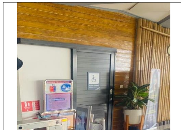
Gambar 5. Penggunaan face recognition

Kebahagiaan dirasakan ketika seluruh tahapan perjalanan, mulai dari kedatangan hingga keberangkatan, berjalan tertib dan nyaman. Dengan demikian, makna bahagia bagi wisatawan berkaitan dengan interaksi dan kelancaran sistem pelayanan. Wisatawan juga menekankan bahwa suasana stasiun yang nyaman menjadi faktor penting dalam kebahagiaan. Lingkungan yang bersih, tertata rapi, dan tidak membingungkan memberikan rasa tenang selama menunggu keberangkatan. Proses keberangkatan yang teratur serta layanan informasi yang membantu semakin memperkuat pengalaman positif tersebut.