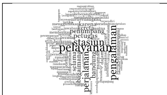
Gambar 4. Lingkup Analisis Penelitian

Berdasarkan dengan peneliti oleh Permatasari (2020) mendefinisikan pelayanan sebagai setiap tindakan atau kinerja yang dapat ditawarkan oleh satu pihak kepada pihak lain yang pada dasarnya tidak berwujud dan tidak menghasilkan kepemilikan atas sesuatu. Pelayanan terjadi melalui proses dan tidak dapat dipisahkan dari pihak yang memberikannya. Pelayanan muncul sebagai hasil dari kegiatan yang dirancang untuk membantu pelanggan dalam menyelesaikan masalah atau memenuhi kebutuhannya. Pelayanan tidak hanya dilihat sebagai pemenuhan kebutuhan teknis, tetapi juga sebagai bentuk interaksi sosial, kenyamanan wisatawan. Berdasarkan temuan terdahulu menurut Yusran et al (2025) menyatakan bahwa pelayanan memiliki karakteristik utama berupa tidak berwujud, tidak dapat dipisahkan dari proses pemberian, sangat bergantung pada pengalaman pengguna jasa saat menerima layanan.