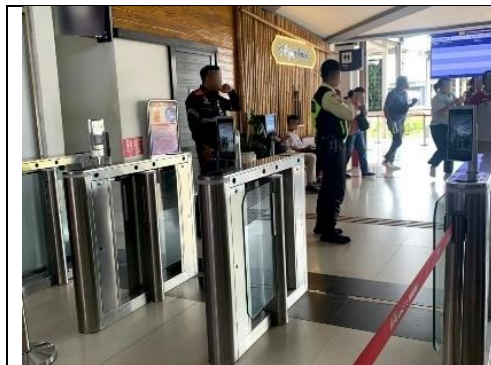
Gambar 3. Area Pelayanan Menuju Peron

Berdasarkan hasil pernyataan memiliki temuan dengan melihat perjalanan kereta bukan hanya sebagai cara untuk berpindah tempat, tetapi juga sebagai pengalaman awal yang meninggalkan kesan pada perjalanan wisata yang akan wisatawan lakukan. Berdasarkan analisis hasil wawancara dengan informan lainnya menyatakan bahwa pengalaman perjalanan dimulai ketika wisatawan berada di stasiun, memasuki bangunan stasiun, menunggu waktu keberangkatan dan ketika keberangkatan. Oleh karena itu wisatawan melihat perjalanan menggunakan transportasi kereta api sebagai waktu yang menciptakan kesan bahwa perjalanan menjadi bagian yang dinikmati dalam keseluruhan rangkaian kegiatan wisata.