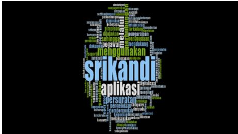
Gambar 1. Gambar word cloud

Hasil analisis word cloud pada Gambar 1. menunjukkan bahwa kata-kata yang paling dominan adalah “SRIKANDI”, “aplikasi”, “menggunakan”, dan “persuratan”. Dominasi kata-kata tersebut mengindikasikan bahwa implementasi kebijakan berfokus pada penggunaan aplikasi dalam pengelolaan surat secara digital. Selain itu, munculnya kata “pegawai”, “operator”, dan “pengarsipan” menunjukkan adanya keterlibatan aktor pelaksana dalam mendukung implementasi kebijakan. Namun, temuan penting tidak hanya terletak pada dominasi kata utama tersebut, melainkan juga pada kemunculan kata “jaringan” dan “kendala” yang relatif signifikan. Secara analitis, hal ini menunjukkan bahwa implementasi kebijakan tidak sepenuhnya berjalan dalam kondisi ideal, melainkan dibayangi oleh keterbatasan infrastruktur. Dalam perspektif sosiologis birokrasi, dominasi kata “jaringan” dapat dimaknai sebagai bentuk ketergantungan aparatur terhadap sistem teknologi yang belum sepenuhnya stabil. Ketidakstabilan jaringan berpotensi menurunkan tingkat kepercayaan pegawai terhadap sistem digital, sehingga secara tidak langsung memengaruhi tingkat adopsi dan konsistensi penggunaan aplikasi SRIKANDI.