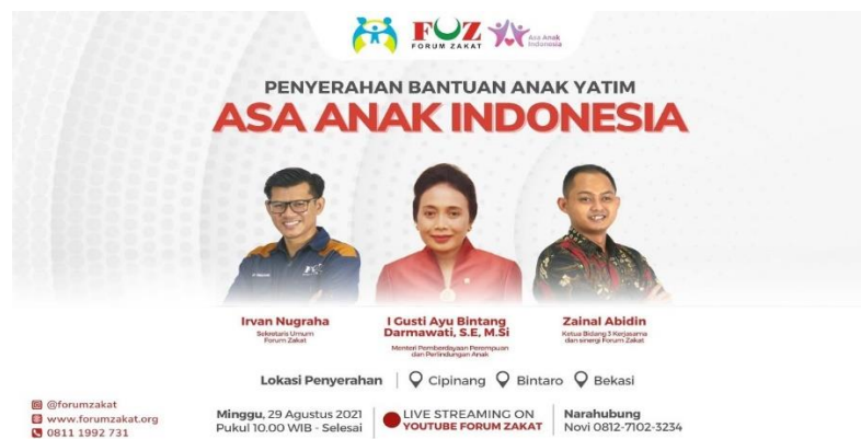
Gambar 4. Simbolis Penyerahan Bantuan