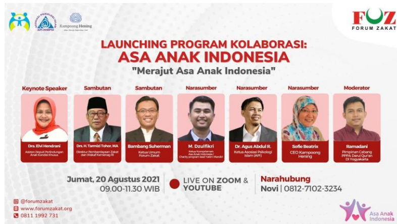
Gambar 3. Peresmian Platform ASA Anak Indonesia

Terjalannya kolaborasi dengan sejumlah pihak ini sesuai dengan apa yang menjadi tujuan program kolaborasi ASA Anak Indonesia. Kerjasama dengan API dan Kampong Hening diharapkan dapat memberikan layanan bantuan tele-psikososial kepada wali yatim terdampak covid. Kehilangan suami sebagai kepala keluarga, di masa yang sulit tentunya membutuhkan dukungan tidak hanya materi namun juga psikis. Hal ini menjadi penting agar setelah pandemi para wali yatim ini tetap mampu bertahan dan dengan optimis mengupayakan yang terbaik untuk masa depan anak-anaknya. Hadirnya unsur pemerintah diharapkan membuat masyarakat menjadi semakin teredukasi untuk kemudian ikut mendukung dan menjadi bagian dari program ini. FOZ sendiri selain membuka platform pendaftaran anak yatim baru terdampak covid juga menyediakan fasilitas kemuduhan berdonasi lewat kanal digital. Selain dukungan masyarakat, pemerintah sendiri juga diharapkan memberikan dukungan untuk data yang masuk lewat platform kolaborasi tersebut.