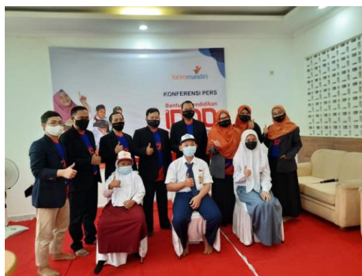
Gambar 2. Rilis Berita Program Bantuan 1000 Yatim Covid Salah Satu LAZ Anggota FOZ (10 Agustus 2021)