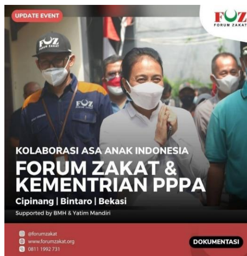
Gambar 5. Keterlibatan Menteri PPPA Saat Penyaluran