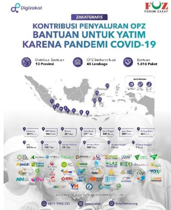
Gambar 7. Infografis Total Bantuan Penyaluran Yatim Akibat Covid-19

Lebih lanjut stok modal sosial yang terbangun selama respons Covid-19 merupakan aset laten yang dapat diaktivasi untuk isu-isu lain yang menjadi isu nasional seperti stunting, kebencanaan, atau pendidikan. Namun, keberlanjutannya bergantung pada pelebagaan mekanisme koordinasi pasca-krisis agar bridging dan linking yang bersifat kolaboratif tidak kembali menjadi bonding yang fragmentatif.