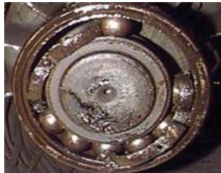
Gambar 15. Kerusakan pada Bearing Akibat Bolt Lepas dari Cage