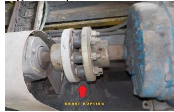
Gambar 16. Kerusakan Pada Couple Pompa

masalah tersebut maka perlu diperhatikan dalam hal pemasangan couple dan karet couple .