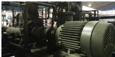
Gambar 1. Tampak Samping Pompa Oli TCU Mesin Longitudinal Strecher

Gambar 1 menunjukkan gambar tampak samping pompa Oli TCU mesin longitudinal strecher . Pompa ini terdiri dari beberapa komponen seperti poros, bearing , mur, baut, casing , impeller , couple , mechanical seal , sistem pelumasan dan lainnya (Sularso, 2004).