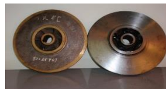
Gambar 4. Impeller

Gambar 4 adalah impeller pada pompa oli TCU dengan spesifikasi: diameter untuk poros 25 mm dengan alur spei 8 x 25 mm dengan kedalaman alur 4 mm, diameter luar 260 mm dan ketebalan 20 mm dengan 6 sirip.