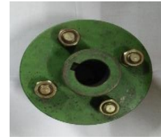
Gambar 9. Couple Pompa

poros 25 mm, alur spei 8 x 25 x 4 mm, diameter luar 120 mm dan tebal 20 mm, baut dengan ukuran M 12 x 20 mm dengan lengan baut panjang 40 dan tebal 14 mm mm, karet couple dengan d = 14 mm dan D = 30 mm.