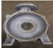
Gambar 7 Rumah Pompa ( Casing )

Rumah Pompa ( Casing ) berfungsi menjaga integritas pompa serta membimbing aliran air melalui proses pergerakan dari saluran masuk hingga ke saluran keluar seperti yang terlihat pada Gambar 7.