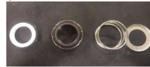
Gambar 10. Mechanical Seal

Mechanical seal dengan tipe untuk as 30 mm dijelaskan pada Gambar 10. Diameter as: 30 mm, tinggi seal: 60 mm, lebar seal: 28.8 mm, lalu untuk keramik dan karet spesifikasi adalah: tinggi karet & keramik 8.4 mm, diameter luar karet 27 mm, diameter dalam keramik 17.5 mm.