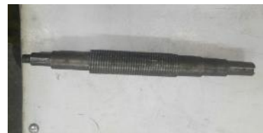
Gambar 5. Poros (shaft)

Gambar 5 adalah poros pompa oli TCU dengan spesifikasi sebagai berikut: ulir baut M 16 x 1.5 x 25 mm, diameter untuk couple dan impeller 25 mm dengan alur spei 8 x 25 mm dengan kedalaman 4 mm, poros untuk inner 30 mm dengan panjang 50 mm, ulir untuk membalikkan oli dengan diameter 50 mm, poros untuk mechanical seal 35 mm, poros untuk bearing 30 mm, cyrclift pengunci bearing dengan diameter 28.5 x 1.5 mm.