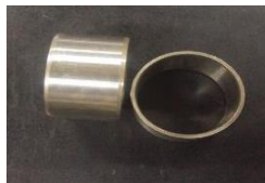
Gambar 8. Inner bearing

Inner bearing berfungsi sebagai komponen yang mendukung pergerakan putar roda, bantalan dan memastikan bantalan berputar dengan bebas, lancar, dan minim gesekan. Gambar 8 adalah gambar inner bearing dengan spesifik: D = 32 mm, d = 30 mm, tebal = 2 mm, lebar = 20 mm.