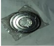
Gambar 6. Bearing

Gambar 6 adalah bearing yang digunakan pada pompa TCU, bearing yang digunakan adalah Bearing SKF 6306-2Z/C3, yakni dengan arti: 6 = jenis leher dengan bantalan bola, 3 = dimensi laher (diameter luar laher 37 mm dan tebal 12 mm), 06 = diameter dalam 30 mm, 2z = zinc (double seal) , C3 = Clarence (keregangan) dalam satuan mikron 1/1000. Bearing tersebut nantinya berkedudukan di rumah pompa seperti yang terlihat pada Gambar 6.