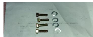
Gambar 11. Baut dan ring per

Gambar 11 adalah baut yang digunakan untuk mengunci komponen tutup dan casing pompa dengan spesifik baut casing : M 10 x 25 x 1,25 dan untuk tutup pompa M 8 x 20 x 1 mm dengan masing-masing diberi ring per dengan ukuran M 10 dan M 8.