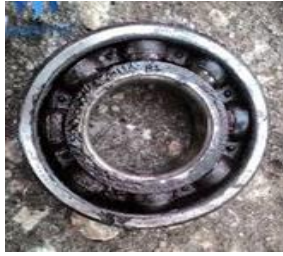
Gambar 14. Kerusakan Bearing Akibat Kurangnya Pelumasan