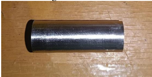
Gambar 2. Spesimen Uji

kombinasi parameter yang telah ditentukan dalam matriks Taguchi.