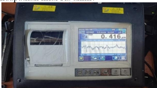
Gambar 5. Surface Roughness Tester

Setelah proses pemesinan, pengukuran kekasaran permukaan dilakukan menggunakan alat Surface Roughness Tester . Pengukuran dilakukan pada tiga titik berbeda pada setiap spesimen, kemudian dirata-ratakan untuk mendapatkan nilai Ra akhir.