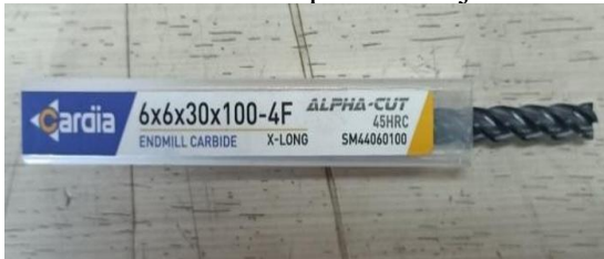
Gambar 3. Endmill Carbide