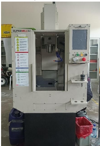
Gambar 4. Mesin Milling CNC (SUPERMILL MK 2.0)

Setelah proses pemesinan, pengukuran kekasaran permukaan dilakukan menggunakan alat Surface Roughness Tester . Pengukuran dilakukan pada tiga titik berbeda pada setiap spesimen, kemudian dirata-ratakan untuk mendapatkan nilai Ra akhir.