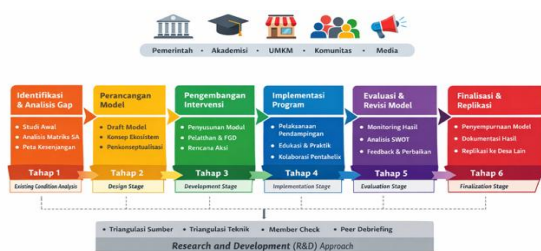
Gambar 1. Diagram Alur Penelitian

Penelitian ini bersifat research and development skala terapan, yang dimodifikasi dari model pengembangan terapan dalam konteks pemberdayaan masyarakat dengan tahapan: (1) Identifikasi kondisi eksisting dan analisis gap; (2) Perancangan model pendampingan; (3) Pengembangan intervensi; (4) Implementasi model; (5) Evaluasi dan penyempurnaan model; (6) Finalisasi model dan replikasi. Proses ini melibatkan informan dari unsur pentahelix yang meliputi pemerintah, akademisi, pelaku usaha, komunitas, dan media. Validitas data dijamin melalui triangulasi sumber, teknik, dan waktu, serta diperkuat dengan member check dan peer debriefing . Pendekatan ini memungkinkan model yang dihasilkan bersifat kontekstual, adaptif, dan berbasis kebutuhan riil di lapangan.